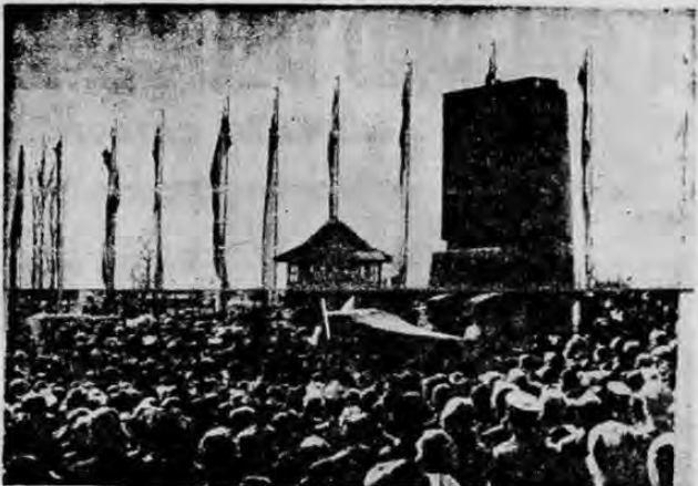
OSWIECIM, Polonia —En esta ciudad que fuera centro de una de las más sangrientas batallas durante la II guerra mundial se levantó este imponente monumento con, a mo recuerdo a los caídos.

Fue la primera vez que un periódico oficial comunista acusa a Liu de estar complicado en una conspiración golpista, aunque la acusación ha sido lanzada en varias ocasiones en carteles murales aparecidos en Pekín. Corresponsales de prensa japoneses dicen que los carteles murales fijados en la capital china ayer describen a Liu y al Secretario General del partido comunista, Teng Hsiao-Ping, como instigadores de un golpe militar y político en febrero de 1966.