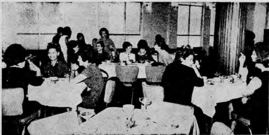
El té de las Damas Leonas de San José en honor de las otras Damas Leonas de las otras ciudades, venidas con motivo de la Convención Regional, y que tuvo lugar el sábado en